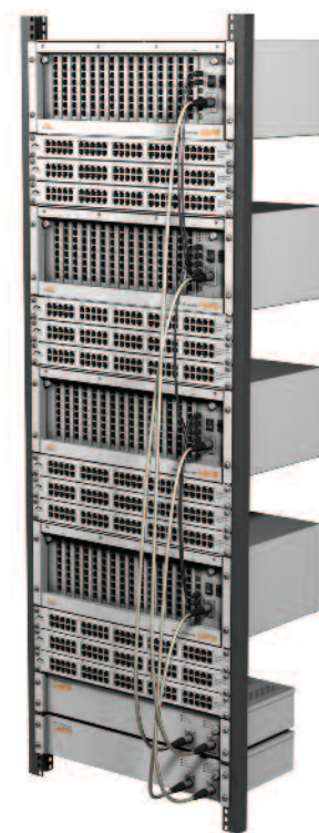
PBX Server Libra

Все изделия Platan гибко приспособлены к потребностям и ожиданиям рынка и находят потребителей среди широкой группы пользователей – от маленьких и средних фирм до больших предприятий, гостиниц и отелей, государственных и общественных учреждений, силовых ведомств и спасательных служб.