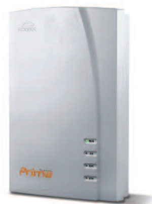
IP ATC Prima

Platan обладает статусом официального глобального партнера компании Yealink – одного из ведущих производителей решений для интернет-телефонии, в том числе IP-аппаратов, а также статусом официального партнера ведущего российского SIP-провайдера SIPNET.